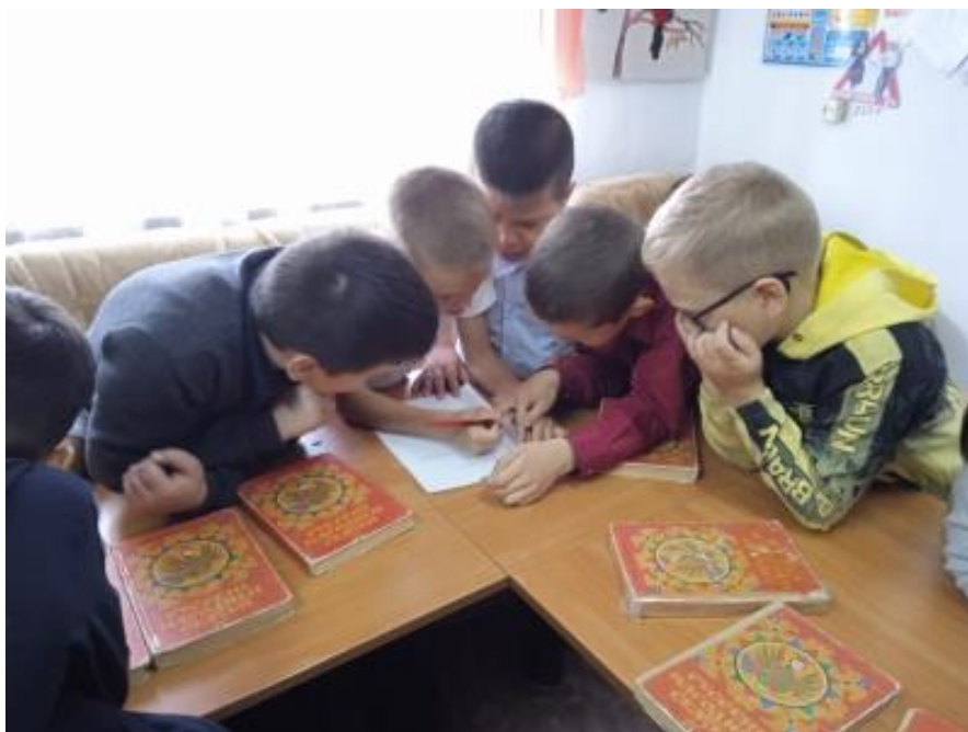
В библиотеке работает «Книжкина больница»